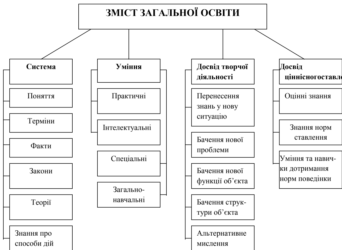
Рис. 1.2. Структура змісту загальної освіти

Основні компоненти змісту загальної освіти А. Кузьмінський подає у такому структурному поєднанні (див. рис. 1.2) [4, с. 140 – 141].