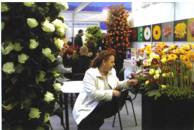
На виставці квітів