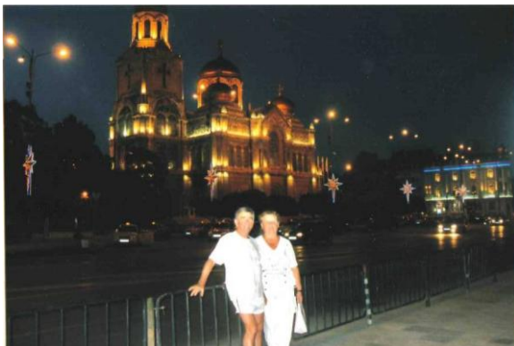
Відпочинок у Варні разом з чоловіком

бентежить моє серце і любов до природи хочеться передати молоді. Мій предмет – це те. Що ф знаю, за що вболіваю, від чого одержую