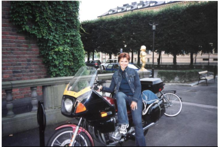
Мій перший залізний кінь

К.: (уявляю «радісний» вираз обличчя викладача =)))))) А чи пам'ятаєте свій перший екзамен?