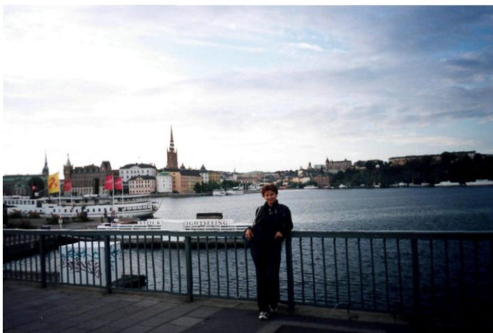
...Одне із найулюбленіших міст – Стокгольм...