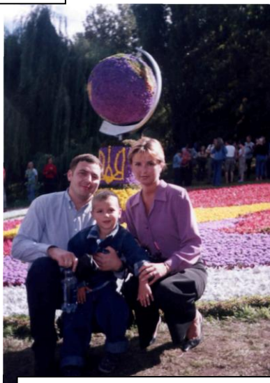
З чоловіком та сином на виставці квітів